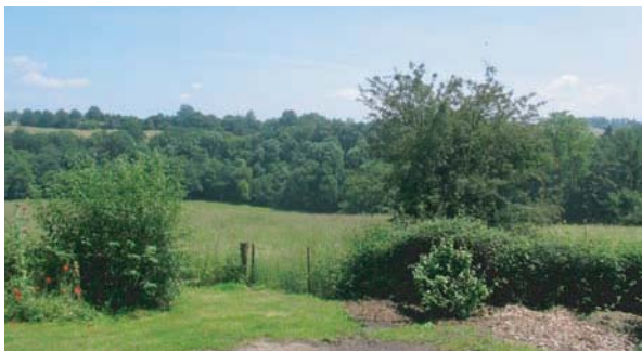
Vue sur la campagne limousine

Au passage, remarquez une fontaine dans un mur ainsi qu'un bac en pierre.