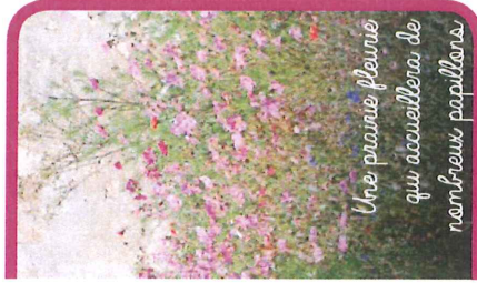
Une prairie fleurie qui accueillera de nombreux papillons.