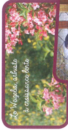
Le Weigela, arbuste à croissance lente